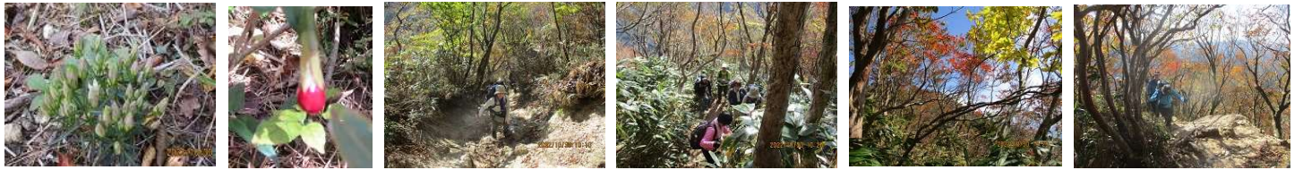
センブリ ツルリンドウの実 足元に注意して 小休止 紅葉・眺望がすばらしい