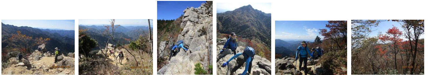
眺望楽しみながら、岩場に行く。紅葉はばっちり。 ゆっくりね。