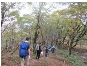
「ほっ〜と紅葉が始まり これも良い感じね・・・」