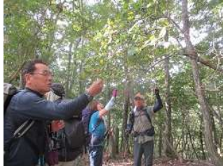
ナツハゼの実を試食「スッパ〜・・・甘くなるのは 11月になってからかなあ、ブルーベリーみたい・・・」