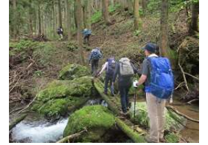
慎重に、木橋を行く