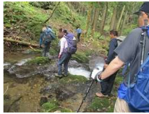
ゆっくり慎重に沢を渡る