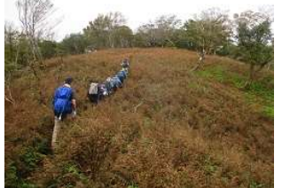
草紅葉も素晴らしい