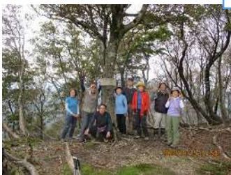
桜谷山山頂にて記念撮影