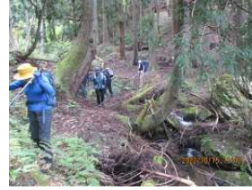
深山の自然に魅了され、足元に注意して