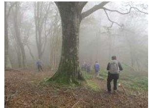
ブナの巨木に魅せられて