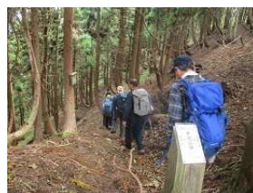
木地山集落へ下山