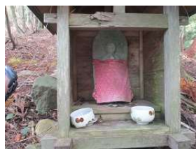
木地山峠：古道福井県への道