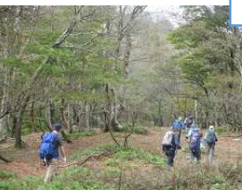
綺麗な樹林を行く