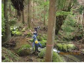
まるで日本庭園のようだ