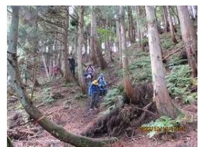
変化に富んだコース