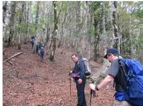
ブナ原生林に入る