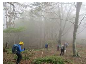
ガスがかかってきた