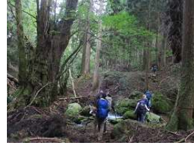
カツラの巨木 甘い香りが漂う