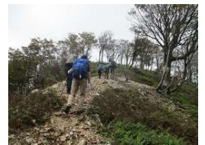
すばらしい眺望を楽しみながら、もうすぐ山頂だ