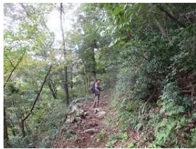
景色を楽しみながら