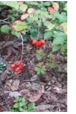
ナンキンナナカマド