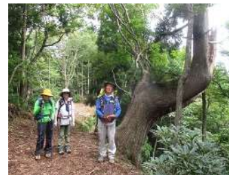
アシュウスギにはえる 木々の生命力に感動して、記念撮影