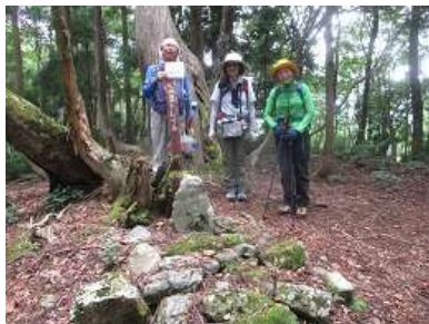
経ヶ岳山頂にて 歴史：経塚