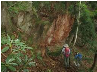
アシュウスギの巨木