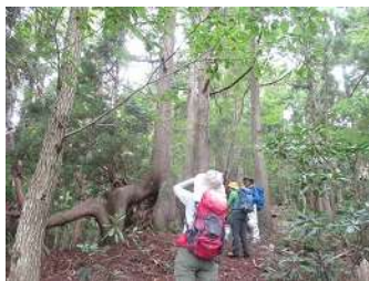
アシュウスギの巨木