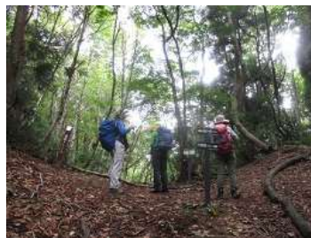
歴史/古道：丹波越え