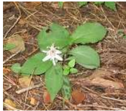
ヤマジノホトトギス