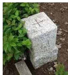
三等三角点：银杏峰山頂にて