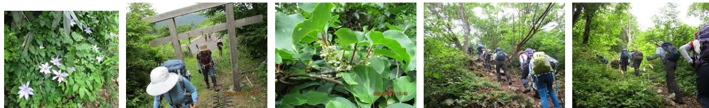
クレマチス 登山口 サルナシ ササユリ・コアジサイなどお花を観察しながら