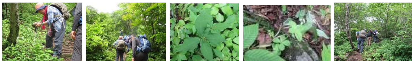
シライトソウを撮る お花を楽しみながら 登る ツクバネソウ ヨツバムグラ 「この山のお花は栄養 たっぷりね」