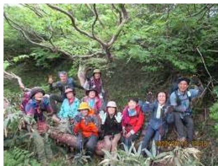
ダテカンバの巨木に乗って：ここで昼食