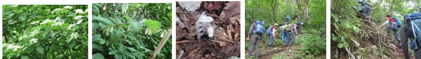
ミズキ ナルコユリ ギンリョウソウ 急な登りもあり、足元に注意して。