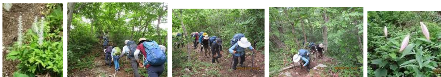
シライトソウ 綺麗な樹林を行く 急な登りもありで、少しハードかなあ・・・。 ササユリ、栄養満点。