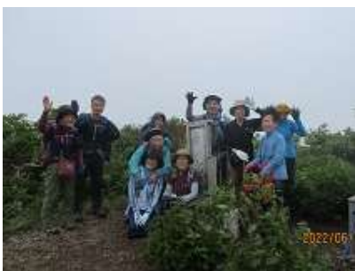
山頂にて記念撮影