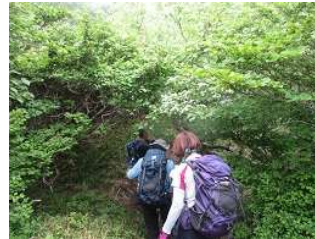
お花のトンネルに行く