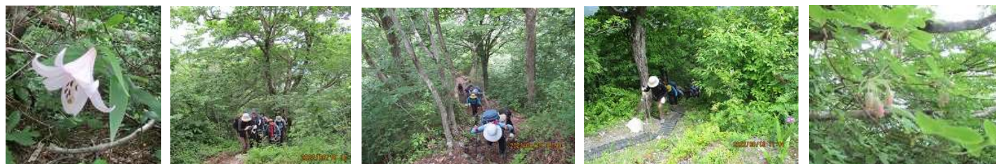
綺麗に咲いてくれて アズキナシ・ウスギョウラクなど、いろいろ咲いていて、「良い山ね」「植生が豊かね」など 会話も弾む ありがとうございます。