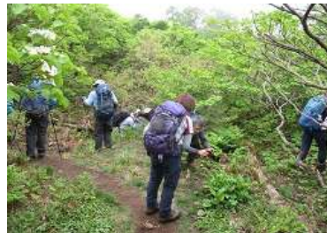
サンカヨウの、観察会/撮影会