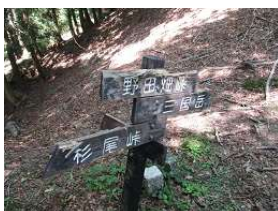
三国峠近くでは長池の側に行く