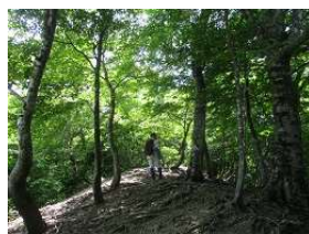
綺麗な樹林を行く