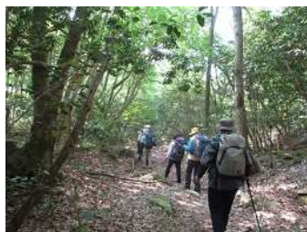
イン谷口から登る