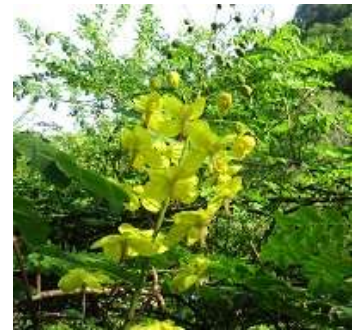
ジャケツイバラの花