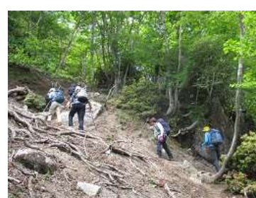
岩場もあり、急な坂を行く