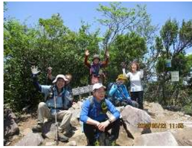
堂満岳の山頂にて記念撮影