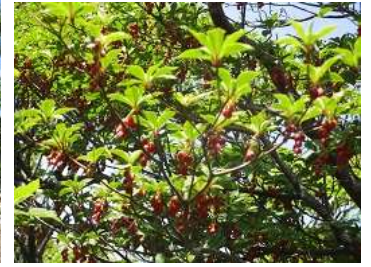
ベニドウダンの花