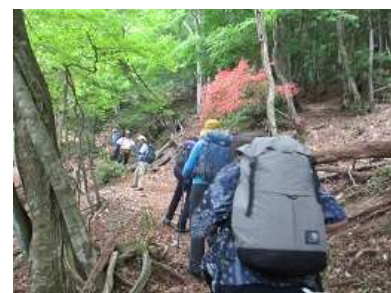
ヤマツツジ咲く道を行く