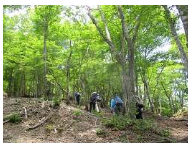
木漏れ日が素敵、微風が心地 よい