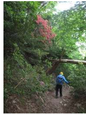
ヤマツツジの咲く道 を行く