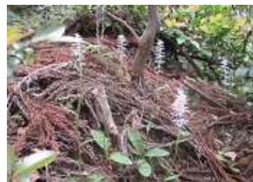
シライトソウ たくさん咲いた