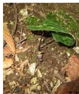
カンアオイの花 花は地面についている