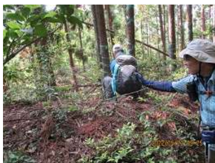
シライトソウを撮る