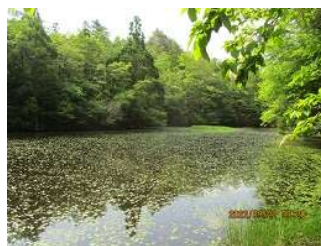
ノタノホリ：モリアオガエル の卵があちこちに