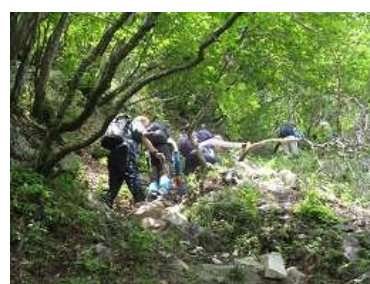
今日、一番の難所を行く