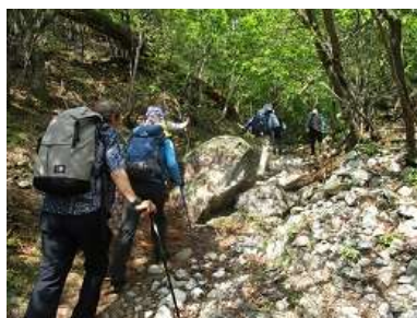
岩場もあり、ルンルン・・・