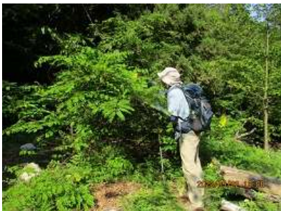
ジャケツイバラを撮る