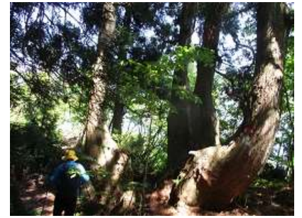
アシュースギの奇木・巨木