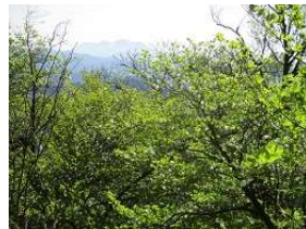
シロヤシオもあちこち花盛り・・・