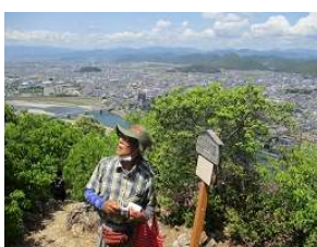
眺望も抜群・・・