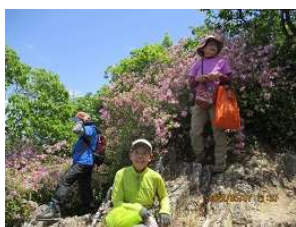
モチツツジが綺麗