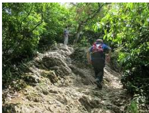
岩場で緊張の連続