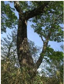
巨木も見応えあり 1