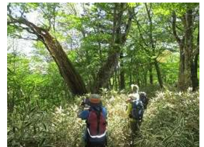
巨木：頑張っています いつも元気をいただきます