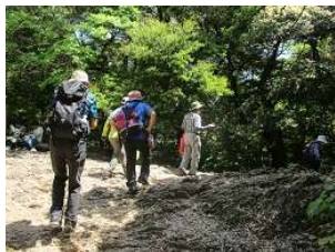
瞑想コースを行く