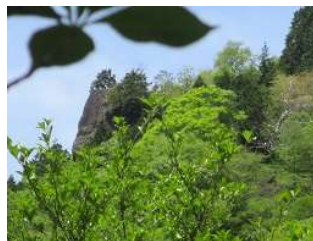
下山コースからの岳美岩