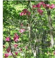
ユクグミミツバツツジ