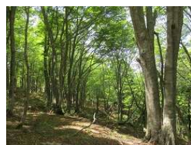
滝谷山のブナ原生林