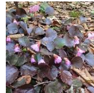
キンキマメザクラ