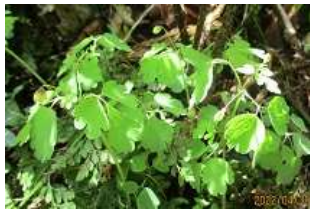
サンインシロガネソウ