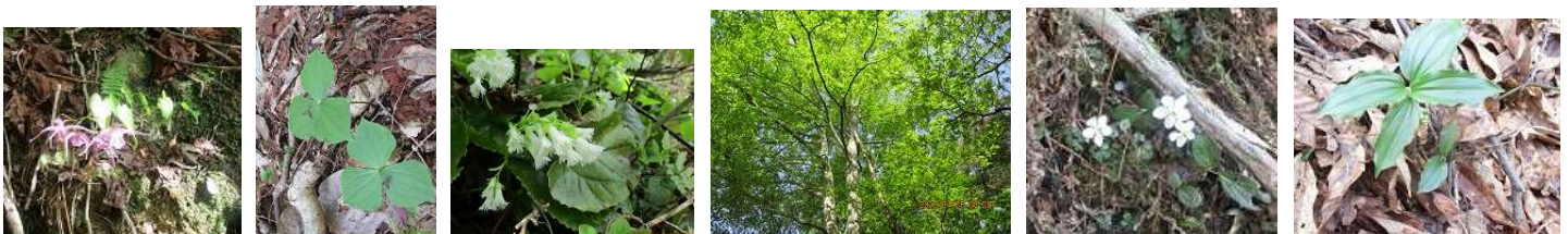
イカリソウ エンレイソウ ヤマカガミ ブナ バイカオウレン ユキザサ