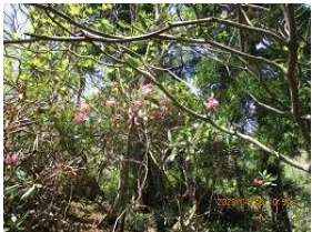
滝谷山のシャクナゲのお花：あちこちに咲く