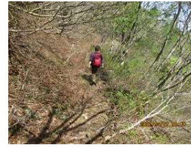
萌黄色の山々を楽しながら