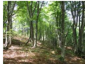
滝谷山のブナ原生林