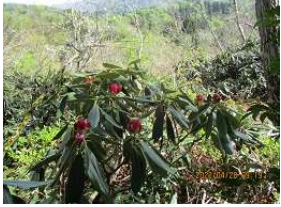
シャクナゲお花があちこり咲く