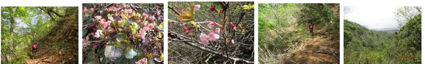
ブナ原生林を行く オオイワカガミ キンキマメザクラ お花を楽しみながら 遠景