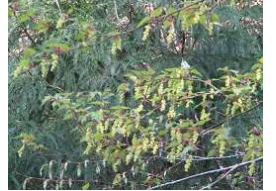
トクワカソウを 撮る トクワカソウ オオカメノキが際立って います ウリカエデのお花