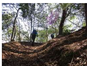
ミツバツツジ街道に行く