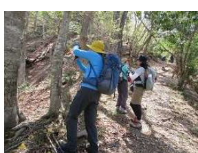
お写真を撮ったり、トレッキング日和を満喫