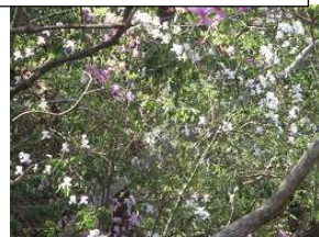
ミツバツツジの白色