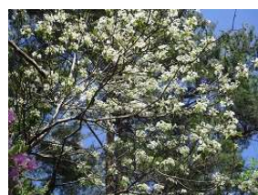
オオカメノキの花