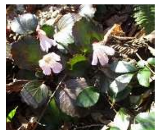
蛇谷ヶ峰山頂で記念撮影 山側をバックに 反対、琵琶湖側をバックにして 下山 記念撮影 トクワカソウ