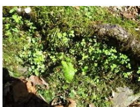
かわいいネコノメソウ