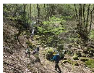
綺麗なお庭！ゆっくり散策を楽しむ