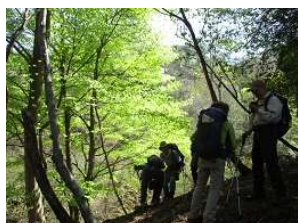
イヌブナの新緑が際立って綺麗、素晴らしい！