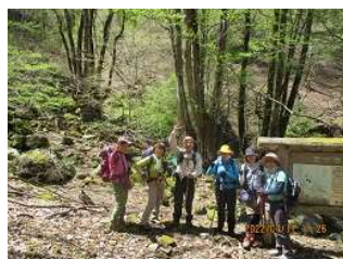
カツラの谷で記念撮影