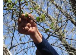
シロモジのお花が満開 ちょっと長旅で、みなさん、お疲れの様子 眺望を楽しみながら オオカメノキのお花 ここで昼食です。 が咲く様子を観察