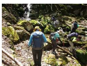
ワサビのお花など