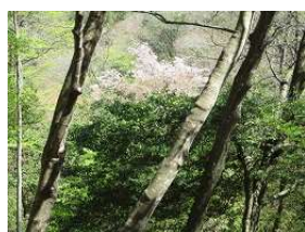
綺麗な山肌！萌黄色「素晴らしい」