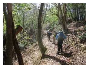
イヌブナの新緑がすばらしい