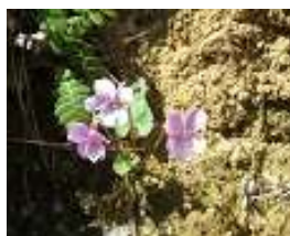
スマレもいろいろ咲き誇る