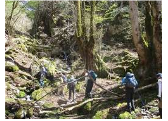
ヤマザクラがあちこち 満開 ネコノメソウ うっとりするほど 綺麗な萌黄色・・・ 足元に注意して