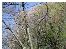
ヤマザクラも満開