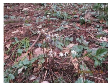
オウレンのお花が群生して綺麗