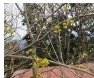
アブラチャンの花