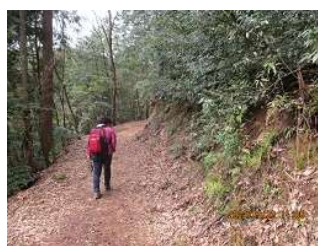
あちこちお花を探して