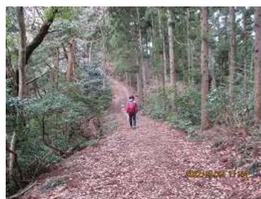
お花を探しながら散策