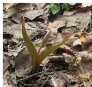
カタクリのお花はまだ蕾です