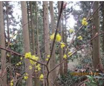
アブラチャンの花