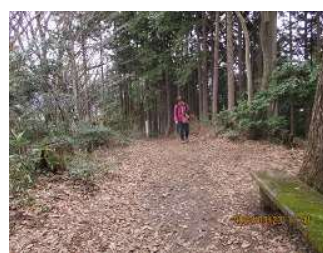
シュンランが増えて楽しみです