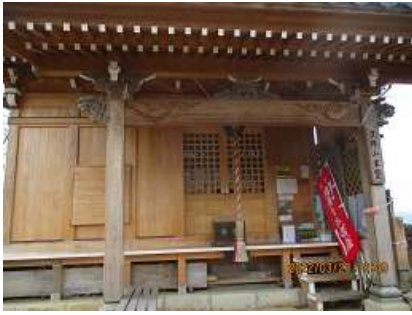
新しくなっていました