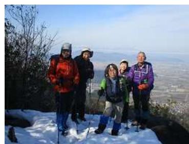
展望を楽しみ、記念撮影