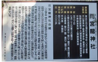
御社があまりにも立派でびっくり。近江商人の発祥の地よね。