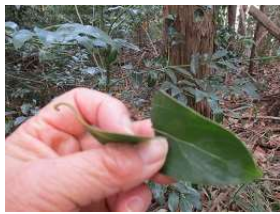
ヤブニッケの香を確かめる 気持ち良い。暖かくなってきました