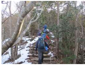
続くね。階段・・・