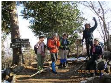
繖山山頂にて記念撮影