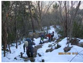
足元に注意してね