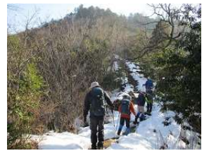
残雪が。ゆっくりね。