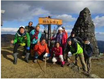
綿向山山頂にて記念撮影