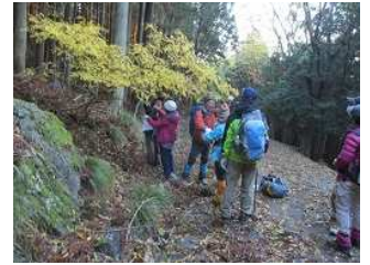
サンショウの実の収穫体験 バター焼き用

「ナメコの御汁が食べられる・・・」と、ニコニコ笑顔。会話も一段と弾みます。 お疲れさまでした。