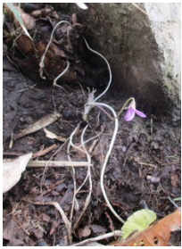
可愛いスマレが・・・ ピークに立つ