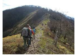
綿向山山頂を目指して