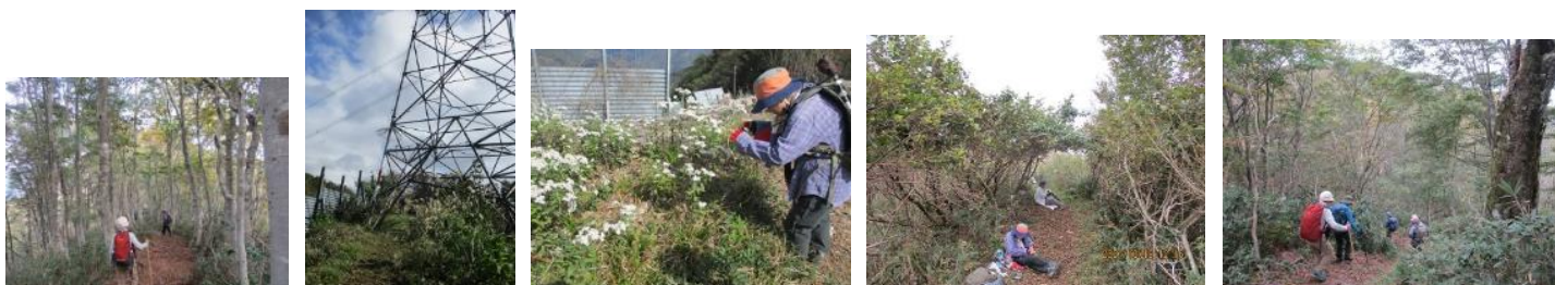
シロヨメナの群生