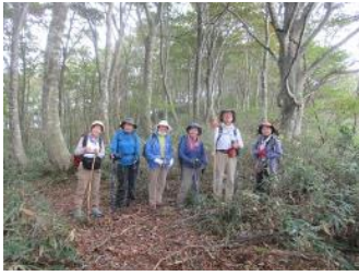
綺麗なブナ原生林で記念撮影