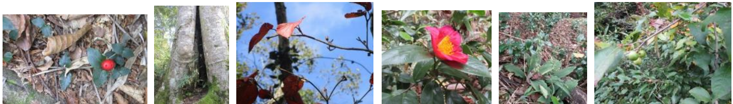
ツルアリドウシ ブナ巨木 オオカメノキのうさぎさん ユキツバキ ナツエビネ アブラチャンの実