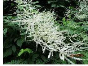
トリアシショウマ