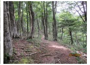
ブナ原生林に行く