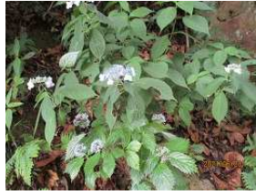
コアジサイとヤマアジサイ