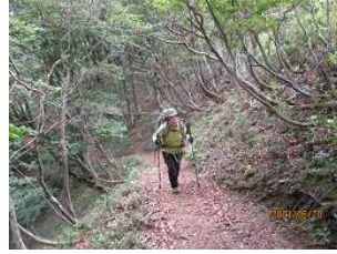
気持ち良い森林浴・・・