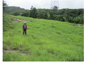
お疲れさまでした