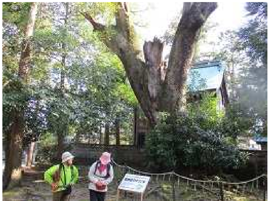
森神社：樹齢1200年以上といわれるダマの巨木