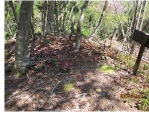
日爪城跡:オオイワカガミ