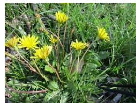
カンサイタンポポ