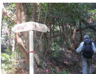
神爾谷・釈迦岳の分岐