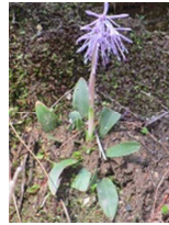
ショウジョウバカマ