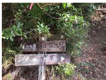
カラ岳・釈迦岳分岐