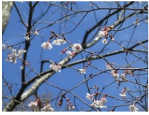
キンキマメザクラ