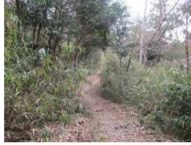
妹背の里近く登山口から