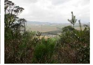
野寺城址からの眺望