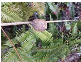
カマキリのタマゴ