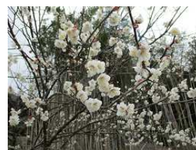
梅の花が綺麗・香りが良い