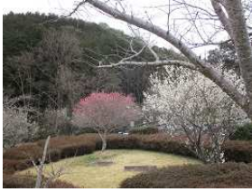
梅のお花がきれい

植生豊かな、眺望も素晴らしく、歴史もたっぷり楽しめます。とても気持ち良い里山です。みなさまのご参加お待ちしております