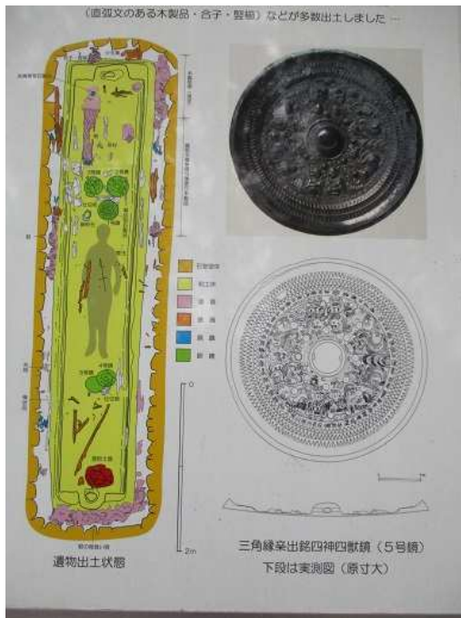
雪野山山頂 古墳の説明文