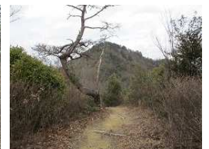
前方の山が雪野山