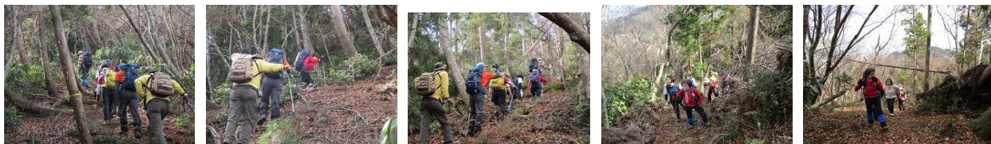
岩阿沙利山山頂への登り