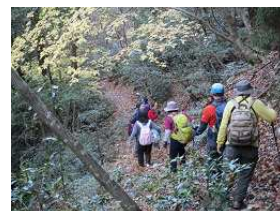
下山：日吉神社へ下りる お疲れさまでした