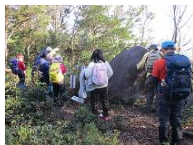
ろくわ岩から打下地区を眺望