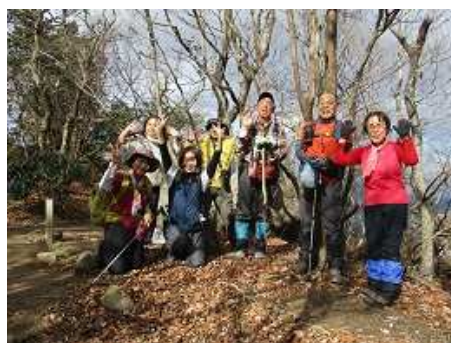
岩阿沙利山山頂にて記念撮影