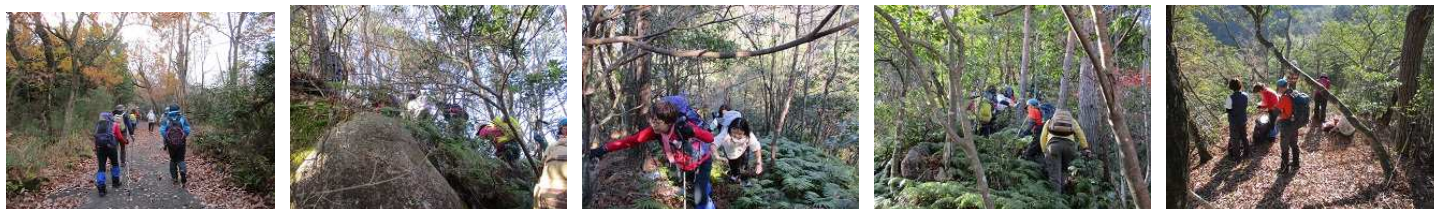
林道も初冬の模様