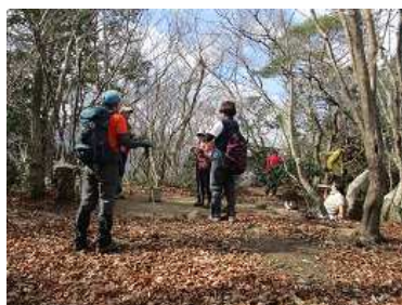
岩阿沙利山山頂にやっと到着