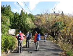
竜王山の説明板を読む