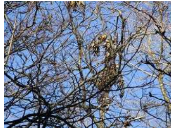
熊が実を食べた跡