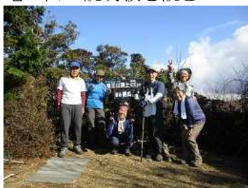
竜王山山頂にて記念撮影