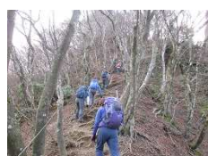
眺望を楽しみながら