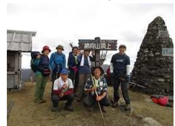
綿向山山頂にて記念撮影