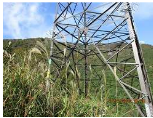
遠景は野坂岳山頂