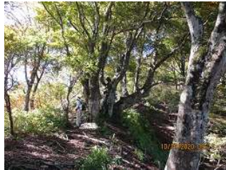
綺麗な眺望の良い尾根コース