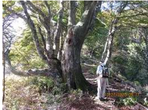
ブナの大木があちこちに