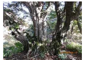
ブナの大木があちこちに