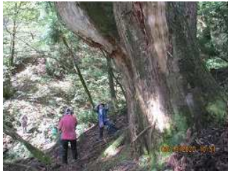
アシュースギの巨木に魅せられて