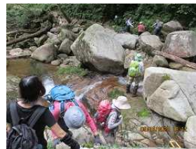
八ッ淵の滝：大摺鉢