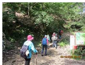
ガリバー旅行村から八ッ淵の滝へ