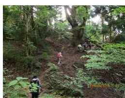
アシュースギの巨木