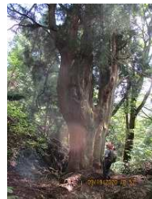
とにかく樹林が綺麗で大満足