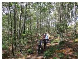
コヤマノ岳のブナ原生林