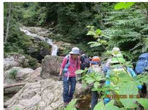
全員無事渡る。“涼”をたっぷり感じる。