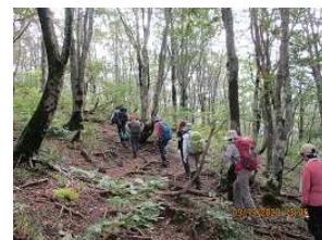
コヤマノ岳山頂へ