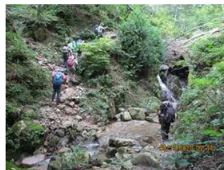
足元に慎重になる①