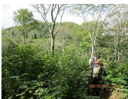
遠景：武奈ヶ岳山頂