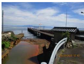
今津棧橋跡・琵琶湖周航の歌発祥地