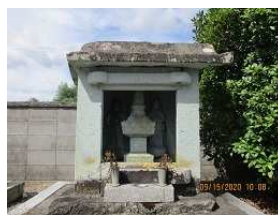
柴田勝次の供養塔