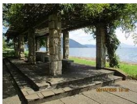
琵琶湖岸：浜辺を行く