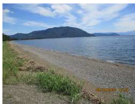
静かな浜辺ウォーク を楽しむ