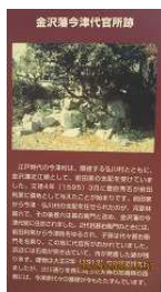
金沢藩今津代官所跡