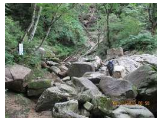
八ッ淵の滝を經由して