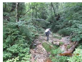
綺麗な樹林の緑陰ウォークを楽しむ