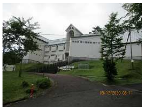
ガリバー旅行村から