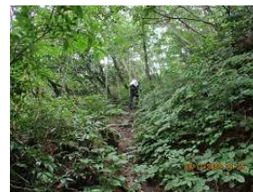
綺麗な樹林を行く