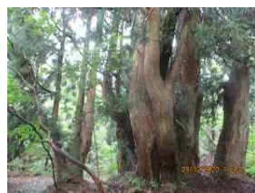
イブルキのコバ アシュースギの巨木が多い