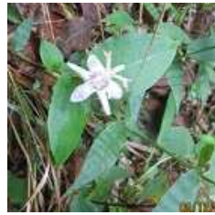
ヤマジノホトトギス