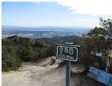
岩根山山頂 405m。素晴らしい眺望を楽しめます