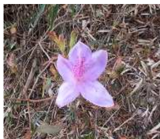
モチツツジの花がところどころに咲いています