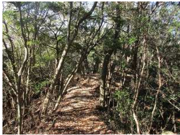
綺麗な樹林ウォークを楽しむ