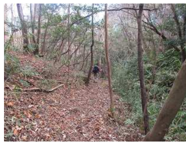
周回コースを下山