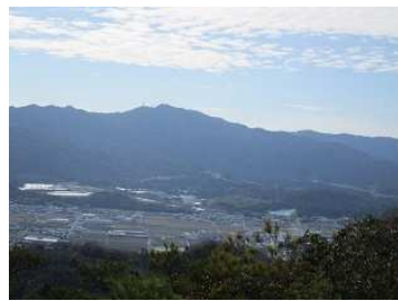
忘年登山で楽しんだ阿星山