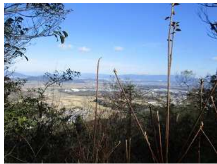
眺望がとても良い