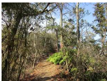
周りの景色を楽しみながら