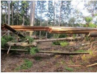
① - 4 处理済