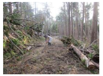
②- 2 处理済