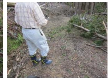
③- 3 处理済