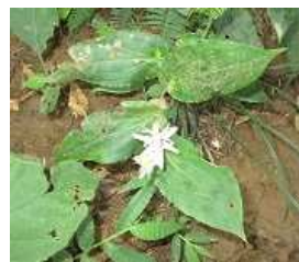
ヤマジノホトトギス