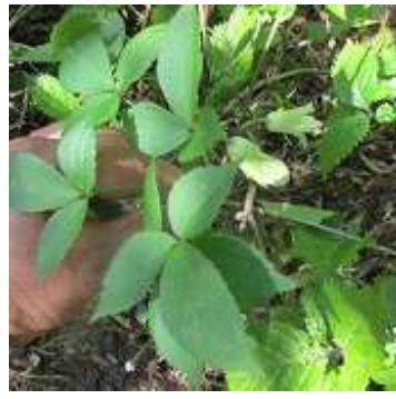
トリガタハンショウヅル