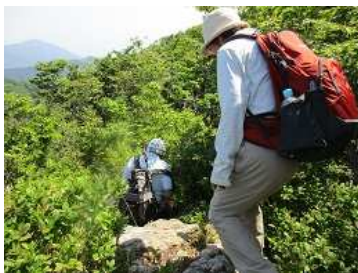
岩場もあり、変化に富んだコース 電波塔