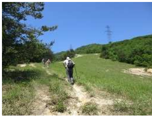
国境スキー場から