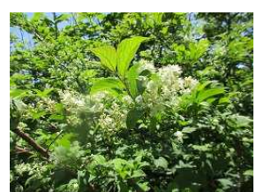
アズキナシ 次ページへ