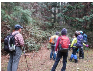
登山口(長壽寺から登る)