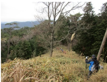
眺望を楽しみながら