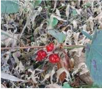
あちこち、試食を楽しんだ フユイチゴ；甘くて美味しい