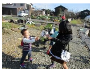
自分たちで遊び具を作って。