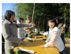
竹細工：昼食用竹食器作り