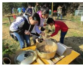
高島市朽木産の コシヒカリ