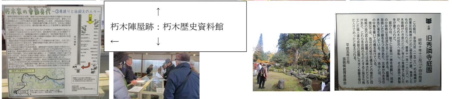
朽木氏岩神館旧秀燐寺庭園にて