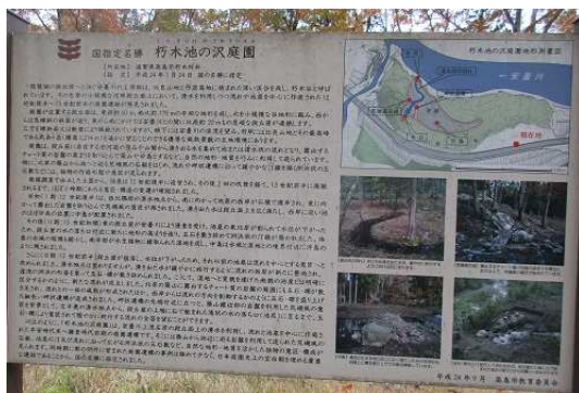
朽木池の沢庭園にて ①