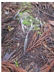
小鳥の羽 かなり大きな鳥のようね