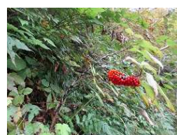
コウライテンナンショウ