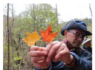
イタヤカエデとミネカエデ