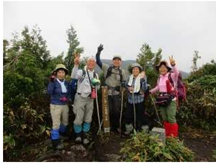
粃糠山山頂にて記念撮影