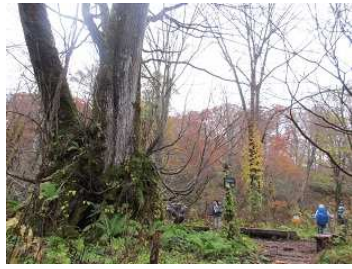
カツラのみごとな巨木に魅せられて