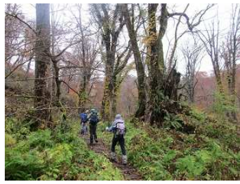
ブナの巨木・紅葉も素晴らしい