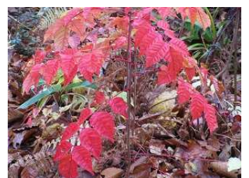
天生峠(あもうとうげ)