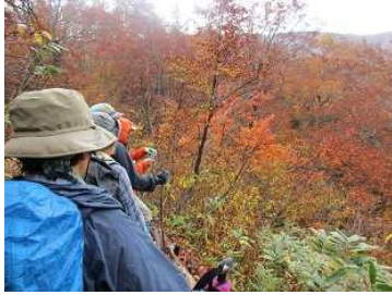
きれいな紅葉の樹林を楽しみながら、山歩を楽しむ