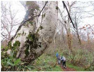
みごとなダテカンバの巨木