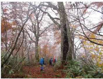
ブナ・ダテカンバの巨木 に魅せられて