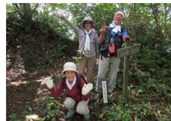
青葉山東峰山頂にて