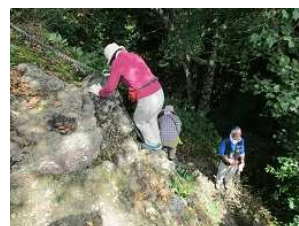
足元に注意して下りる