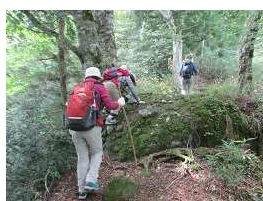
綺麗な樹林に行く