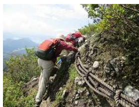
ロープあり「ああ怖っ・・・」