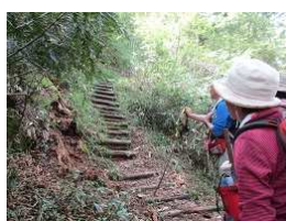
ブナが朽ち自然に変わる様子を観察