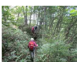
綺麗な樹林に行く