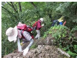
岩場あり、ゆっくり