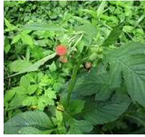
ベニバナボロギク