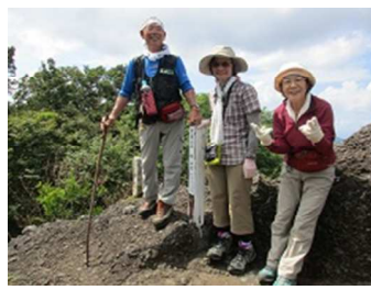
青葉山西峰山頂へ